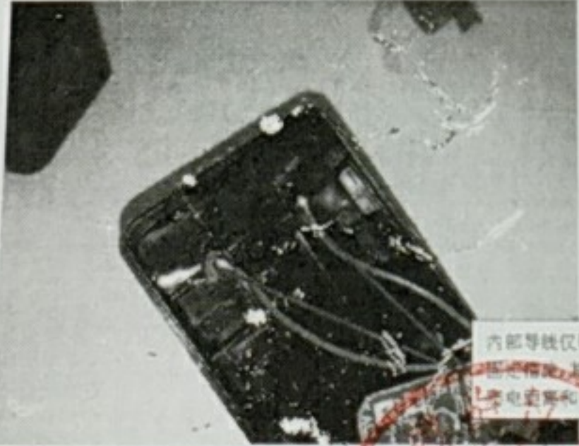
内部导线仅靠锡焊，无其他固定措施，可能会影响爬电距离和电气间隙。