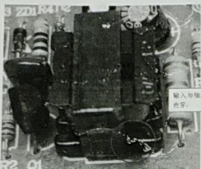
输入与输出电路之间被击穿。