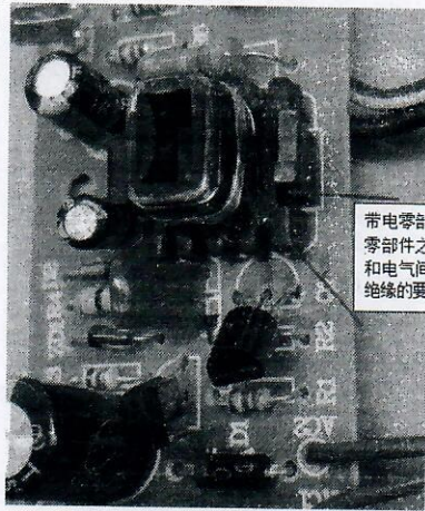
带电零部件与中间导电零部件之间的爬电距离和电气间隙不符合基本绝缘的要求。