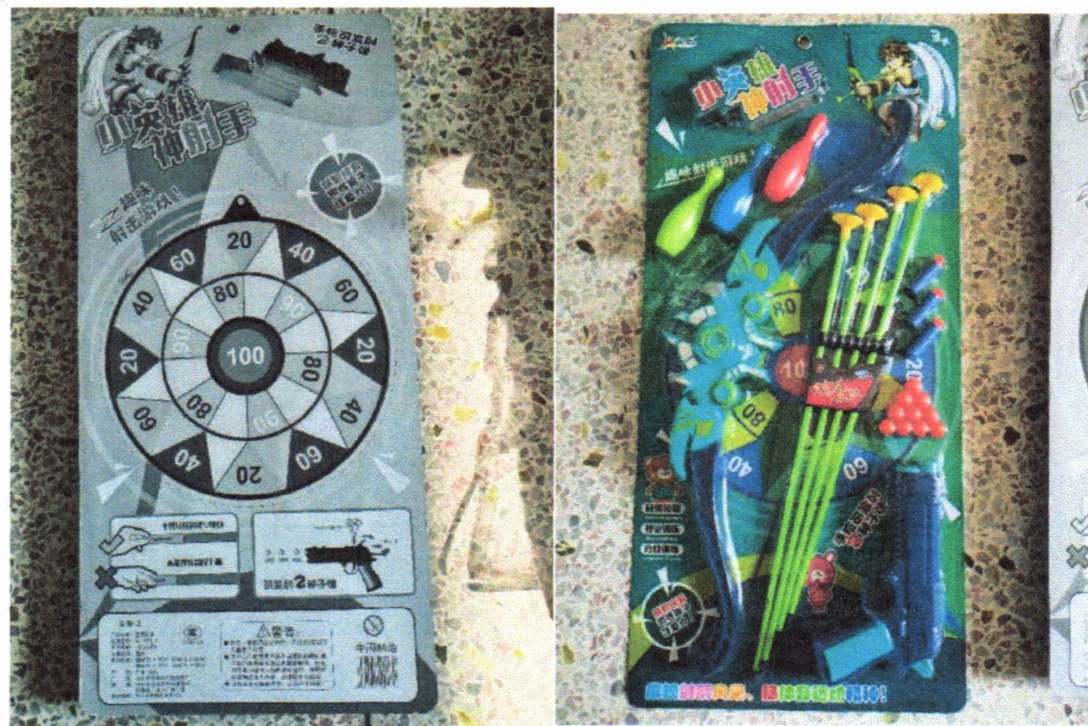
该产品为②NO.0776-9 益智玩具产品